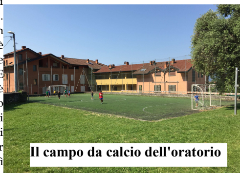
Il campo da calcio dell'oratorio