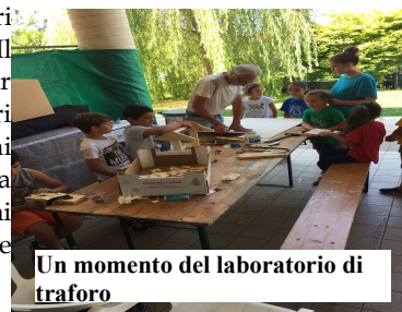
Un momento del laboratorio di traforo