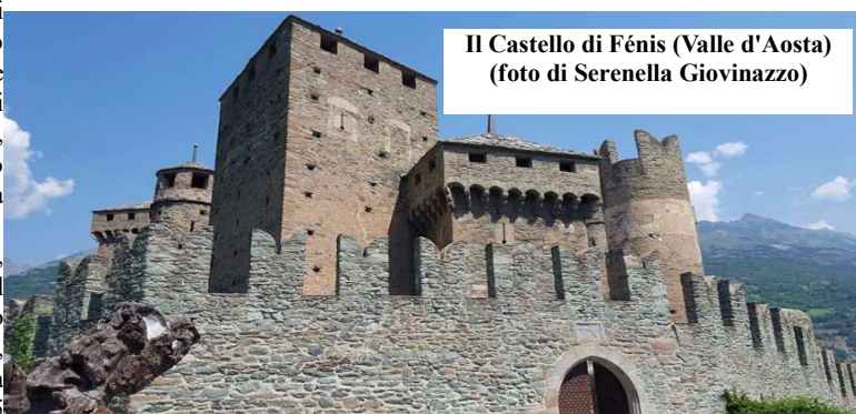
Il Castello di Fénis (Valle d'Aosta)

circa e ci siamo salutati: è stata un'esperienza fantastica!